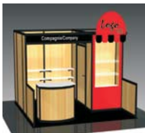
Modèle 1 centre (10' x 10')