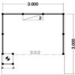
Plan aérien centre 10' x 10'