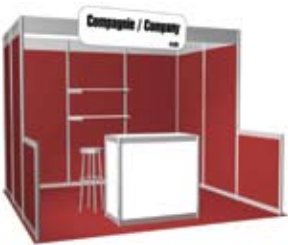
Forfait B-2 (10' x 10')