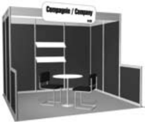
Forfait B-1 (10' x 10')