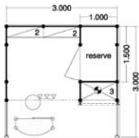
Plan aérien centre (10' x 10')