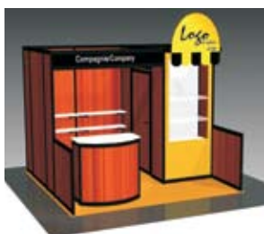
Modèle 2 centre (10 x 10) Tablettes arrière en option