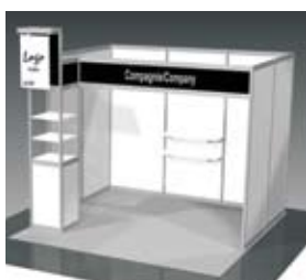
Modèle de centre 10' x 10'